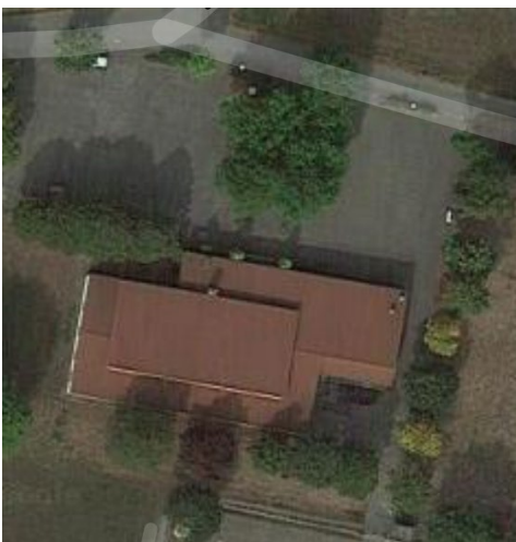
Gemeindehalle mit Parkflächen

Aushänge informieren über die wichtigsten Verhaltens- und Hygieneregeln (richtig Hände waschen/desinfizieren, Niesen/Husten, Abstand, Körperkontakt).